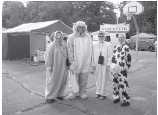
Laurin Markkinat (2005)